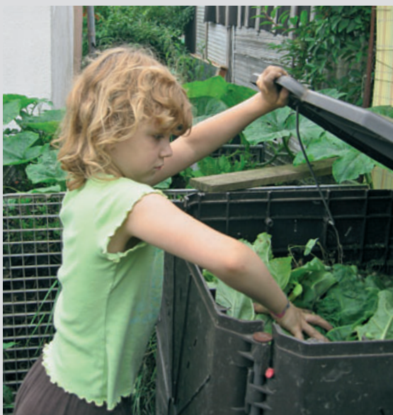
Günstiger als die Anlage eines platzraubenden Komposthaufens ist für kleine Gärten die Anschaffung bzw. der Bau von mindestens zwei gut zu handhabenden luftdurchlässigen Kompostbehältern

Die Vorteile der Kompostierung liegen auf der Hand: Gesunde Pflanzenabfälle brauchen nicht abtransportiert zu werden, wertvolle Nährstoffe werden dem Boden mit dem Kompost wieder zugeführt. Eine Kompostecke sollte daher in jedem Kleingarten ihren Platz finden. Aber Achtung, auch mit einem Zuviel an Kompost kann der Boden überdüngt werden! Eine Bodenprobe alle drei bis fünf Jahre ist daher in jedem Fall sinnvoll!