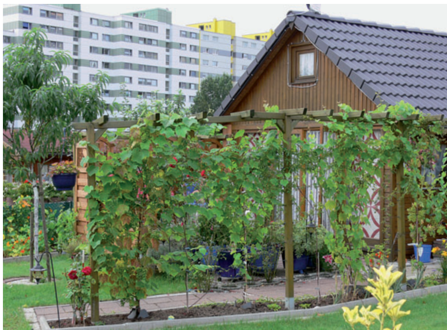
Als Sichtschutz für den Sitzplatz eignet sich auch sehr gut eine Pergola, die z. B. mit Wein begrünt werden kann

Ein „Starterpaket“ mit Sortenempfehlungen zu den für den ersten eigenen Obstgarten besonders geeigneten Obstarten können Sie von der Website des Bundesverbandes Deutscher Gartenfreunde (BDG), www.kleingartenbund.de , herunterladen. Dort sind außerdem die in dieser Ausgabe auf den Seiten 6 bis 12 und 28 bis 34 veröffentlichten Texte und Bilder zum Herunterladen hinterlegt – damit Sie sie bei Ihrer Vereinsarbeit nutzen können.