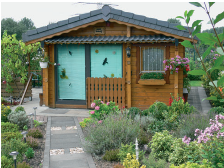
Der Hauptweg des Gartens sollte mindestens 90 bis 120 cm breit sein, damit zwei Personen nebeneinander und auch eine Schubkarre Platz haben

Für Nebenwege im Nutz- und Ziergartenbereich sind Wegebreiten von 40 bis 50 cm (teilweise auch weniger) ausreichend. Als wasserdurchlässige Materialien eignen sich hier z. B. Holzhäcksel, Rinde, Kies oder Splitt, die jedoch einer wesentlich höheren Pflege bedürfen als feste Materialien. Entscheidet man sich dafür, die vorhandenen Wege des Vorbesitzers zu nutzen, sind diese