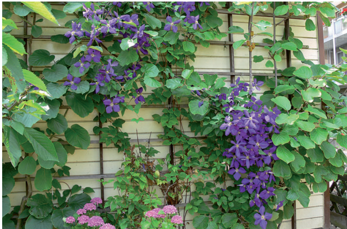
Eine individuelle Gestaltung der Gartenlaube kann z. B. durch eine Berankung mit Kletterpflanzen, hier mit einer Waldrebe ( Clematis ), erreicht werden

Baustil und Farbgebung der Laube sollten dem Gartencharakter entsprechen und nicht störend ins Auge fallen. Eine individuelle Gestaltung kann z. B. durch die Berankung mit Kletterpflanzen sowie die Anbringung von Blumenkästen