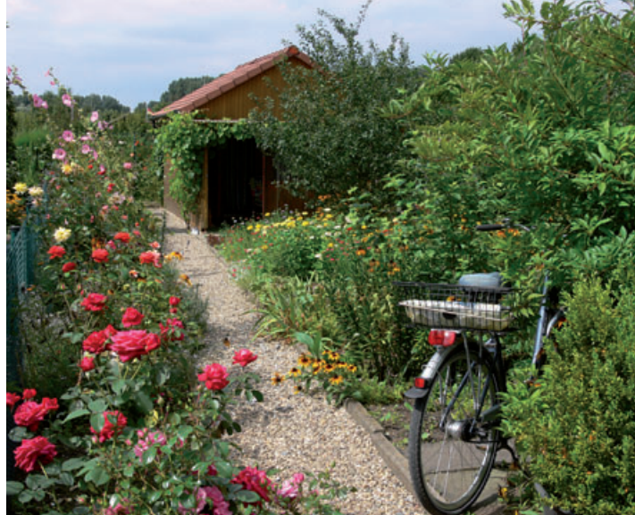
In der Regel übernimmt der Neupächter einen Garten, der durch die Laube, Wege, einen Sitzplatz und ein Grundgerüst an Zier- und Obstgehölzen vom Vorpächter schon eine Grundstruktur hat. Gartenanfänger sollten sich deshalb zunächst mit den Standortfaktoren vertraut machen und die Gartenplanung daran anpassen.

Nicht alle Standortfaktoren, z. B. das Klima, lassen sich einfach ändern. An-