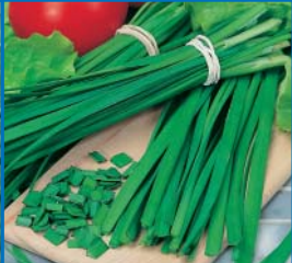
48050 Schnittknoblauch 'Neko'