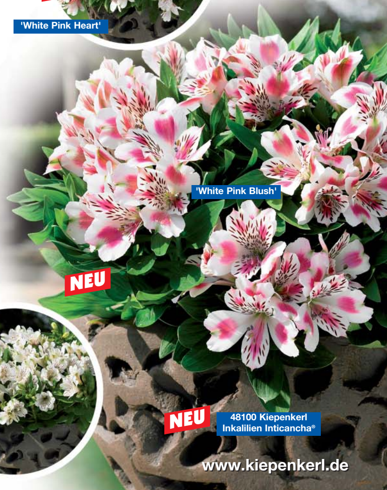
'White Pink Blush'