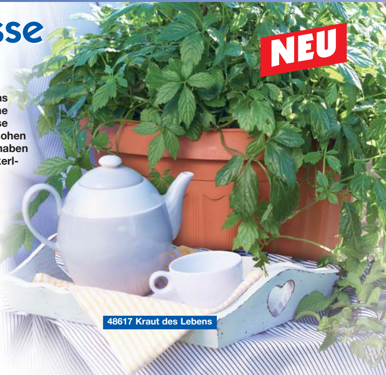
48617 Kraut des Lebens