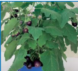
48563 Aubergine 'Ophelia'