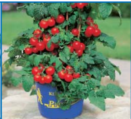
48028 Tomate 'Miniboy'