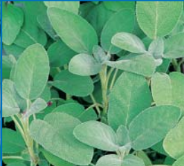
48636 Salbei 'Culinaria'