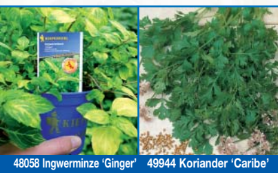
48058 Ingwerminze 'Ginger' 49944 Koriander 'Caribe'