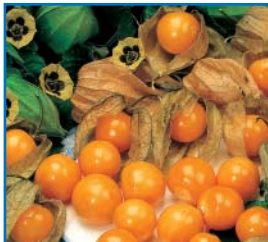
48592 Andenbeere 'Goldvital'