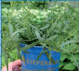
48052 Estragon 'Pfefferkorn'