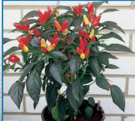
48656 Gewürzpaprika 'Red Missile'