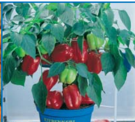
48588 Paprika 'Nazar'