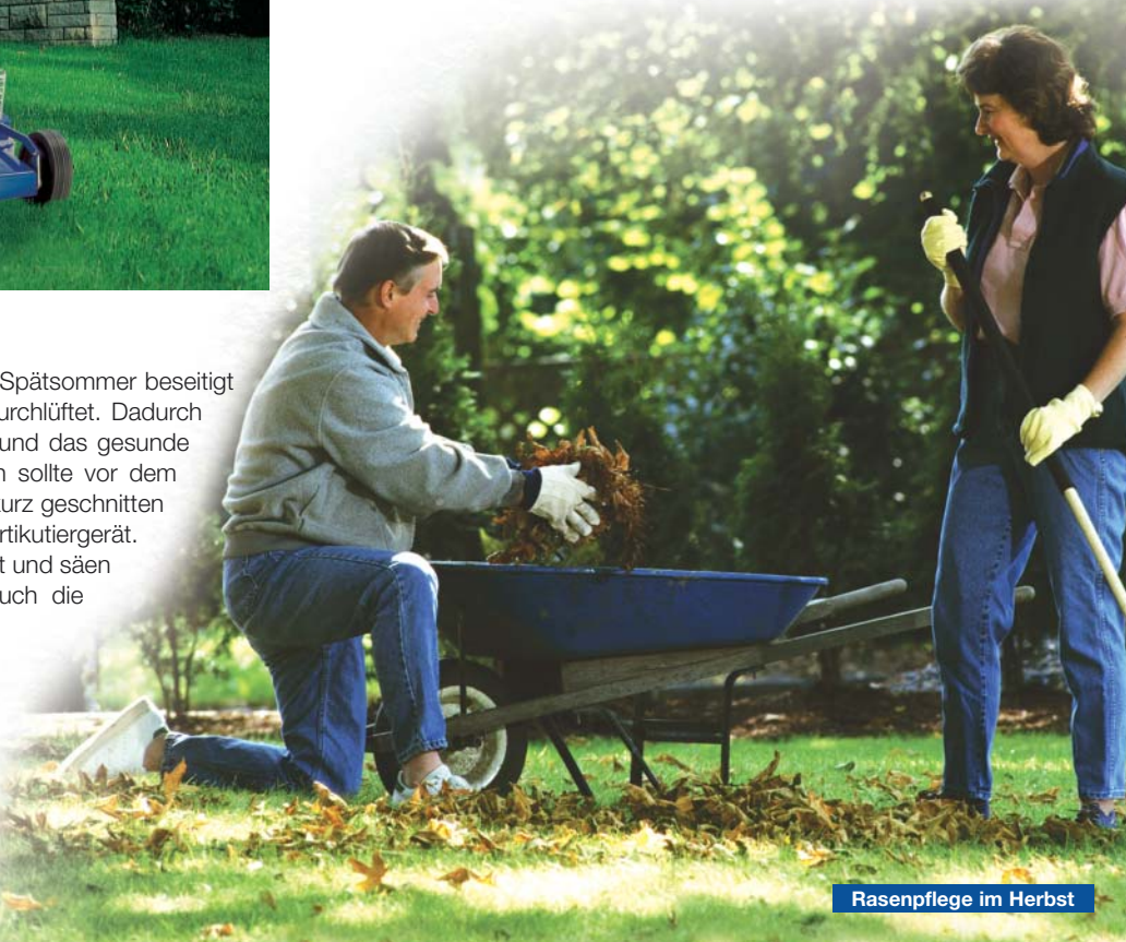
Rasenpflege im Herbst

Keinesfalls kürzer als sonst mähen, ab Oktober den Rasenmäher um eine Stufe höher stellen. Abgefallenes Laub vom Rasen entfernen. Bei Frost den Rasen möglichst nicht mehr betreten. Eine Herbstdüngung empfiehlt sich im September mit einem Kaliumdünger zur Verbesserung der Winterhärte.